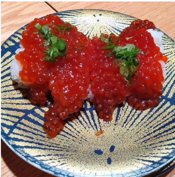
すじこ醤油漬け握り

北海道旅行2日目は小樽に出かけました。小樽運河をはじめレトロな街並み、海鮮・スイーツと心躍ります。ところが本日も娘の体調が芳しくなく、小樽行きの列車が満員でちょっと疲れ、小樽の街並みを歩いてちょっと疲れ、休憩がてら六花亭で「雪こんチーズ」を食べたら、昼食時にはあんまりお腹がすいてないとのことで、小樽グルメランチはお見送りになりました。お寿司・海鮮丼・豚丼・かまぼこ・スイーツと、いろいろ調べたのに実に残念です。とりあえず札幌に戻った時点で娘の元気も回復したので、遅めのランチを取ることにしました。目当てのお店はテレビでもよく取り上げられる人気回転すし店「根室はなまる」さんです。YouTubeで予習した通り、混みやすい札幌駅のJRタワー店を避け、駅から徒歩5分程度の大同生命ビル店に行くとほぼ待ち時間なしで入店することが出来ました。北海道と北陸では全然メニューのラインナップが違いますね！とろにしん・ほたての白子・紅鮭すじこ醤油漬けなど、今まで食べたことがない寿司ネタを食べてみました。そしてホテルへの帰り道、大通り公園で「じゃがバター&焼きとうきび」をつまみにグイっと生ビールをいただき、ちかくにある札幌時計台を見学しました。北海道グルメを満喫です。ところがホテルに帰って、お風呂に入って、さあ夕飯だと思っていたら、今度は妻が疲れ果てて寝入ってしまった。そんなわけで本日も北海道ディナーはお預けで、父はセコマに向かいます（苦笑）今日もYouTubeでオススメされていた、カツ丼、ザンギ焼きそば、チキンたっぷりペペロンチーノとベルギービールを買い込んで部屋飲みして2日目終了です。セコマのパスタや焼きそばは200円以下で驚きのうまさど安さでした。