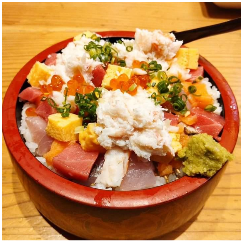
富山空港の海鮮丼