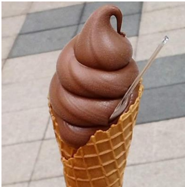
マジサンドチョコソフト