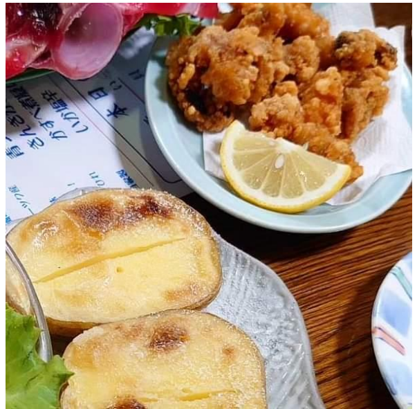
タコザンギじゃがバター