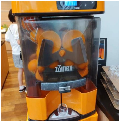
生絞りオレンジジュース

さて、実食です！1日目はスープカレー・ジンギスカン・ザンギ、道産ポークのソーセージ・ベーコンなどを食べ、飲み物は北海道限定乳酸菌飲料「ソフトカツゲン」をいただきました。朝食buffetだけで十分北海道グルメを満喫です！さらにエッグステーションでエッグベネディクトのサーモン版エッグ・モンリオールを注文。お茶漬けコーナーにあったイクラを乗せて「親子エッグ・モンリオール」にして食べてみました。そもそもエッグベネディクト自体名前だけしか知らず、どんな食べ物かよくわかってなかったのですが、半分はスライスしたイングリッシュマフィンの上に、ハムまたはベーコン、ポーチドエッグ、その上にオランダーズソース(マヨネーズに似たソース)をかけたものです。ここに宿泊しなかったら一生食べることがなかったはずであろうエッグ・モンリオール、大変美味しかったです。2日目はエッグベネディクトを注文、気分はニューヨーカーです。エッグステーションではエッグベネディクト以外にもオムレツ・目玉焼き・スクランブルエッグなど8種類のたまご料理をその場で調理し、出来立てを提供してくれます。もちろんこれだけでは足りないので、ご飯の上に焼きほぐし鮭とイクラととろろを乗せて鮭親子丼を作ってみました。創作アレンジもbuffetの楽しみの一つですね。初日2日目と朝から食べ過ぎてしまいました。3日目はエッグフロレンティン(ほうれん草版)を注文。エッグ3兄弟を制覇しました。飲み物は搾りたてオレンジジュース。なんとジュースマシンがその場でオレンジを搾ってくれます。そして気にはなっていたものの、YouTube動画でも誰も食べていなかったフォーを食べてみました。ベトナムのソウルフードで米粉のツルツとした食感とチキンベースのあっさり味が、飲んだ翌朝には最高だと思いました。妻や娘は私の食べてない、ホテルメイドのクロワッサンやパンケーキ、出来立て豆腐やフルーツ、スイーツなどどれも美味しかったとっておりました。新しい発見のあった朝食buffetでした。(金沢歌劇座)