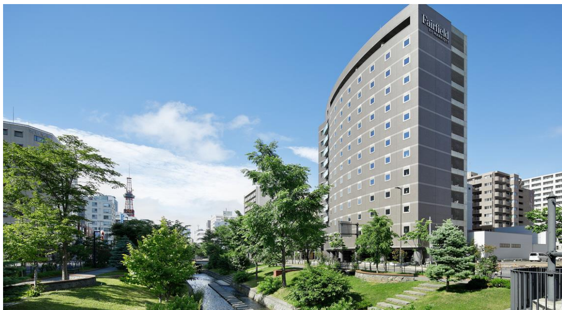
フェアフィールド・バイ・マリオット札幌

公式サイトによるとRestaurant LUONTOの朝食buffet料金は宿泊者で大人2,420円、一般は大人3,300円(小人半額、未就学児無料)となっています。こちらの朝食buffetの特徴は、ライブキッチンで作りあげる自慢の卵料理です。シェフが常駐しその場で調理してくれます。ホテルの客室には朝食buffetマップが置いてあり、buffetの導線や料理の種類などが細やかに記載されており、翌朝のごはんのワクワク感を演出していました。