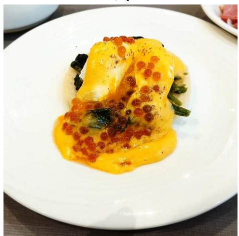
エッグフロレンティン