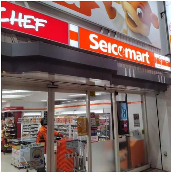
北海道のコンビニ・セイコーマート