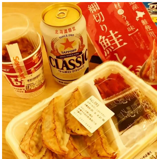
札幌民のソウルフード