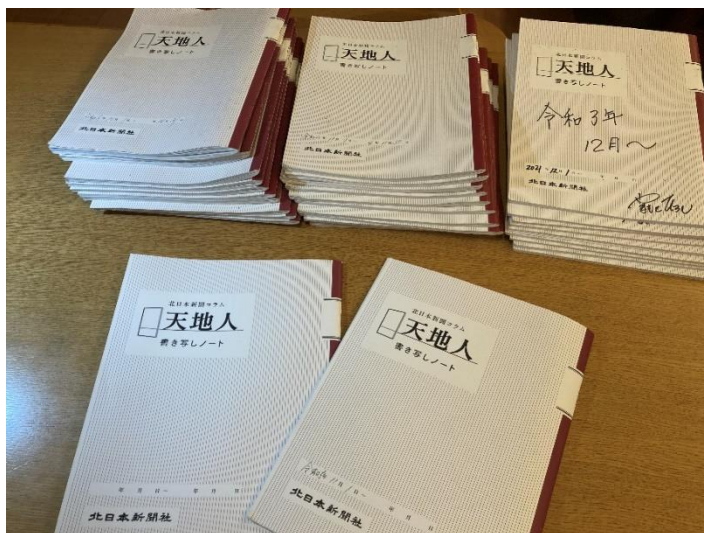
32冊の「天地人ノート」