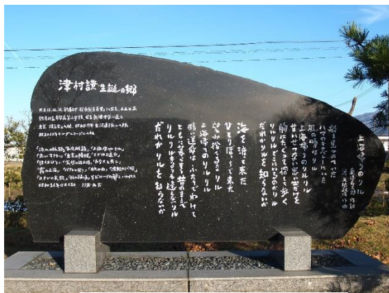
「上海帰りのリル」歌碑