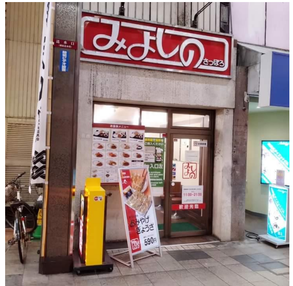
餃子とカレーのみよしの