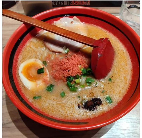
えびそば一幻「えびみそ×あじわい×太麺」