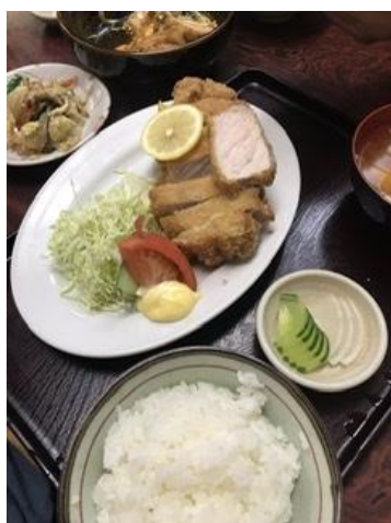
名物・超厚切りのとんかつ定食

さて、先日ある落語家さんの独演会がありました。高座や諸々準備も終わり、マネージメントの方との談笑で『とんかつ』の話題が出ました。その方は、全国各地のとんかつ屋を食べ歩いているようで、『富山のとんかつ屋は他県よりも美味しいお店がたくさんあるよね』と言われ『へえー知らなんだ〜！』と。私もとんかつは好きですが、いつもチェーン店ばかり。昨年の冬までは、当館の階下にも有名チェーン店のとんかつ屋さんがあったので、月に数回はランチや夕飯に食べていました。時間が無い時はカツサンドを買ったりと。最近はチェーン店でも十分美味しいので『おすすめのとんかつ屋さんあったら教えて』と言われ、チェーン店しか思い浮かばず……。逆にその方に美味しかったお店を聞きましたが、知らないお店ばかり……。どこか美味しいお店あったかな???自分のスマホ写真でとんかつの写真を探したら出てきました。