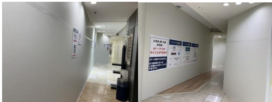
現在のマリエとやま店内

私が勤務している富山県民小劇場がある富山駅前の商業施設『マリエとやま』は建物の老朽化に伴い、現在は大規模改修中です。そして駅前バスターミナルを挟んだ向かい側に今年3月下旬に新たな駅前商業施設『MAROOT(マルルート)』がオープンしました。この新しい施設のオープンに伴い、マリエとやま内にあったテナントの多くは移転や閉店をし、一部店舗を残して現在ビル内は、白い壁に覆われて巨大迷路のようになっています。