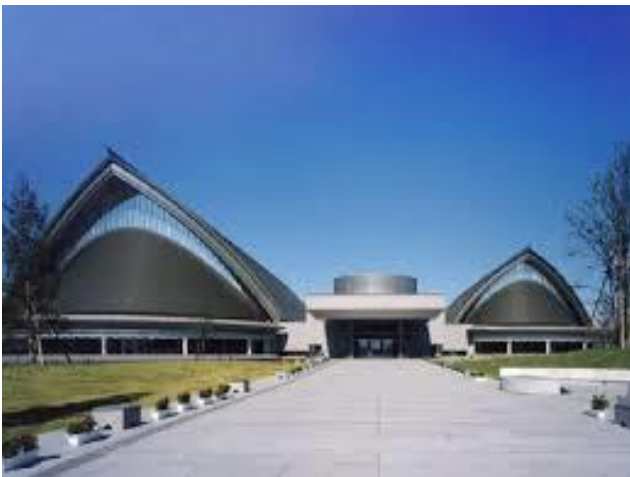
ハーモニーホールふくい 全景