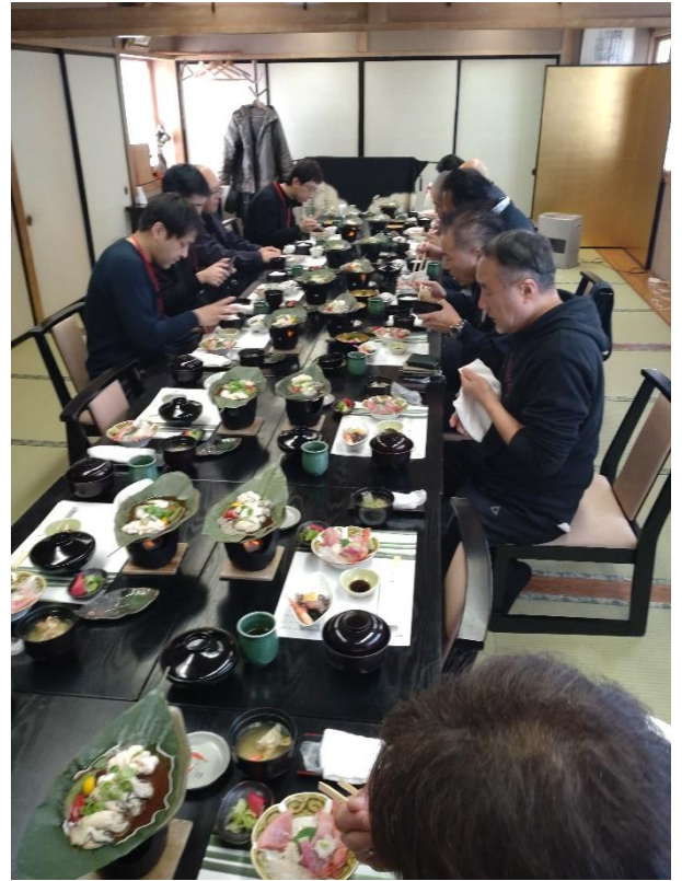
支部懇親昼食会 風景