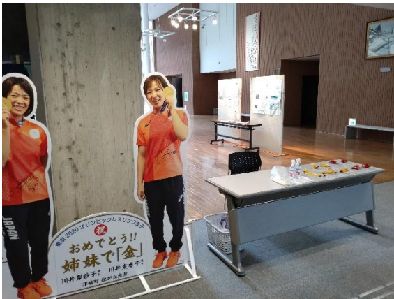
津幡町出身のレスリング川井姉妹がお出迎え