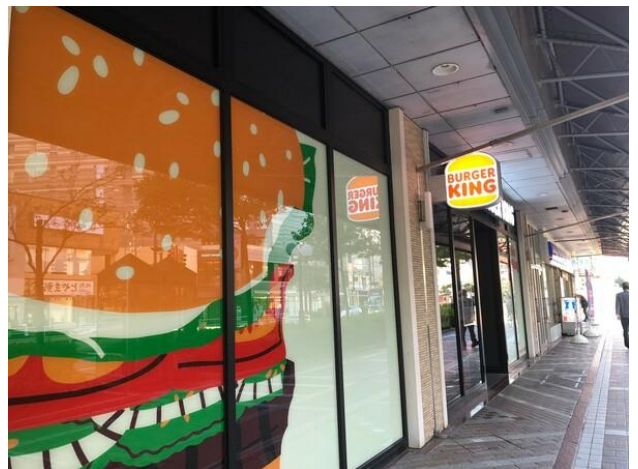
北陸初出店・バーガーキング