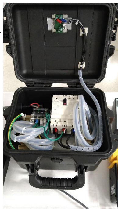
バランス電源装置