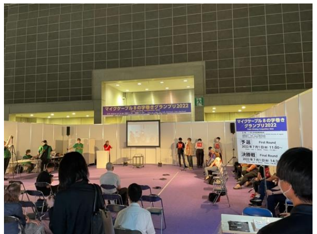
マイクケーブル8の字巻きグランプリ2022の様相