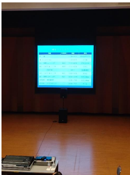
ジャズミキシングトレーニング